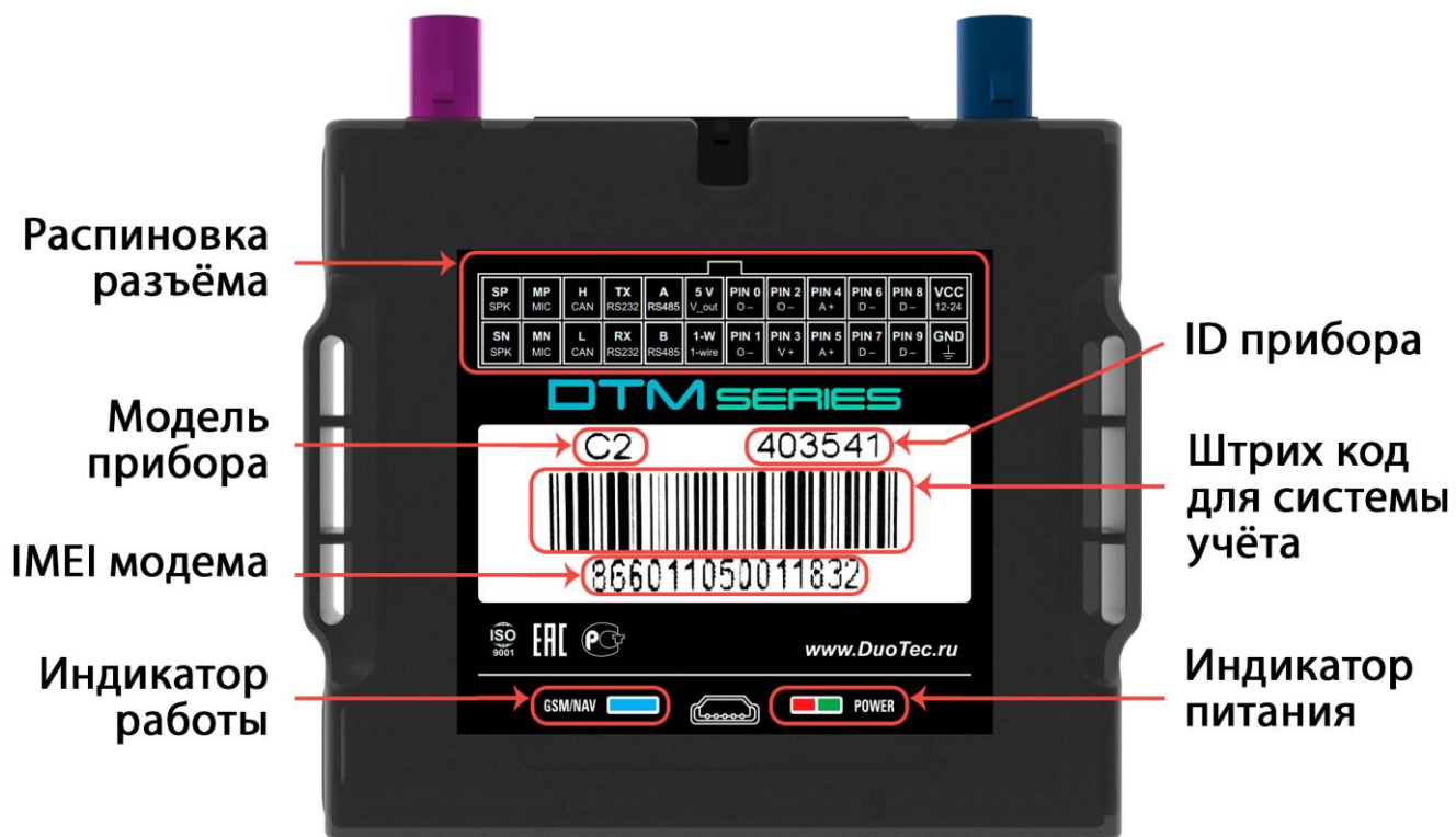
Рисунок 3 – Описание наклейки DTM C series